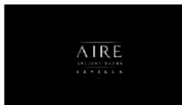
Sevilla | Aire