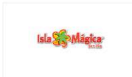
Sevilla | Isla Mágica